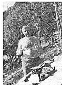
Mokslinė veikla (Bakuriano matematikų konferencijos metu Gruzijoje)